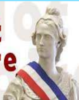
LE MAIRE ET LES CONSEILLERS VOUS PARLENT