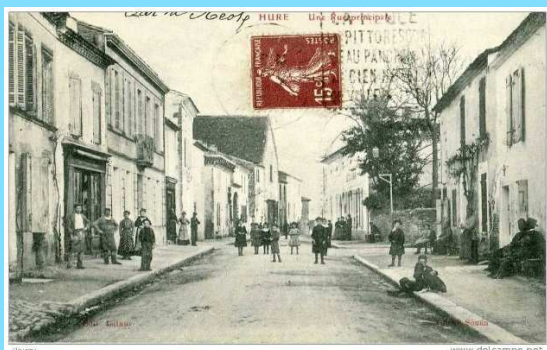
HURE D' HIER