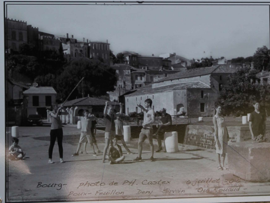
Bourg - photo de M. Castex 6 juillet 1890 Poux - Feuillon Dery Girvain Orlé Rouard