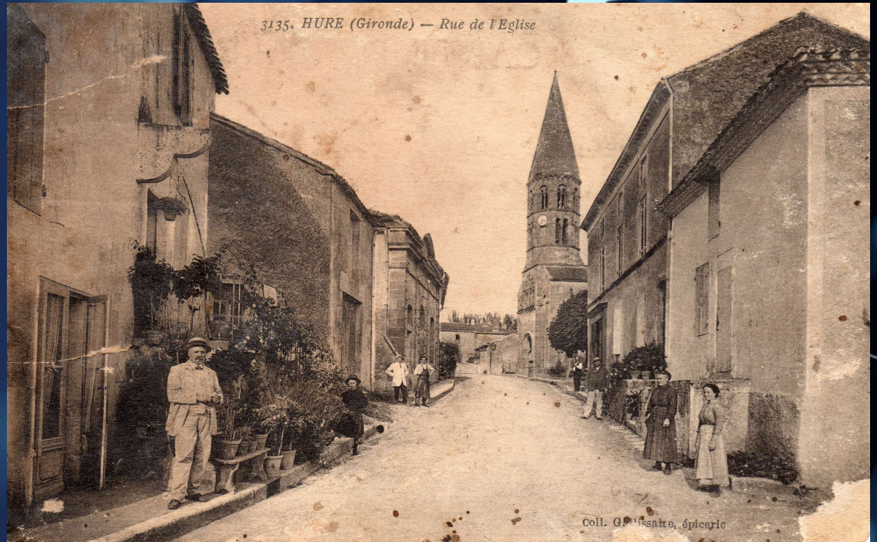
3135. HURE (Gironde) — Rue de l'Eglise