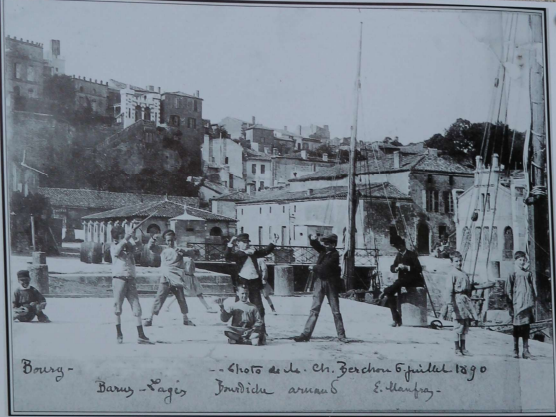
Bourg 6 juillet 1890 Barry - Vagés Jourdieu arnaud E. Manfroy