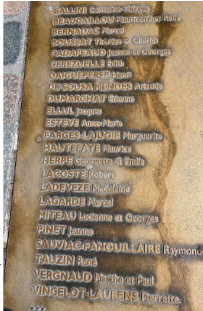
Plaque commémorative des justes parmi les nations, inaugurée en 2008 à Bordeaux

Selon les témoignages rassemblés par le Comité Français pour Yad Vashem 2 , ils ne se sont pas considérés comme des héros mais ont simplement fait ce que leur dictait leur conscience.